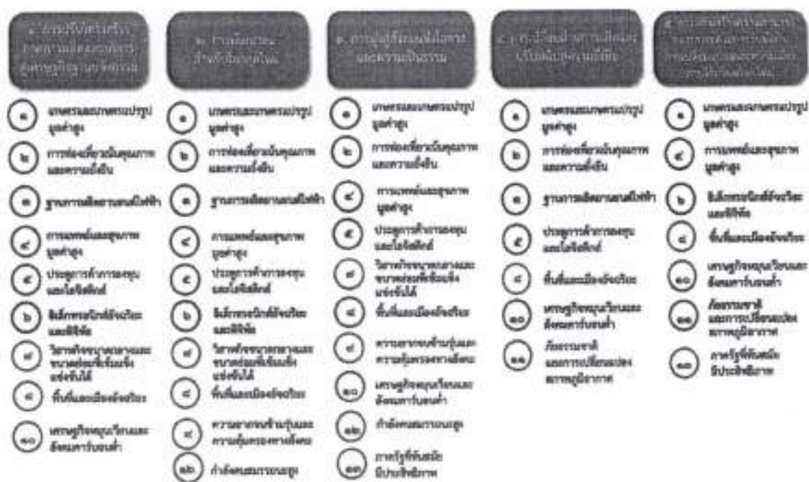
แผนภาพที่ ๑.๑ ความเชื่อมโยงระหว่างกลยุทธ์พัฒนาการพัฒนากับเป้าหมายหลัก