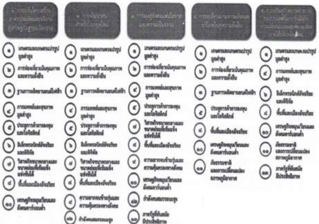
แผนภาพที่ ๓.๑ ความเชื่อมโยงระหว่างหมุดหมายการพัฒนากับเป้าหมายหลัก

ความเชื่อมโยงระหว่างหมุดหมายการพัฒนากับเป้าหมายหลักแสดงไว้ในแผนภาพที่ ๓.๑ โดยหมุดหมายการพัฒนาที่กำหนดขึ้นเป็นประเด็นที่มีลักษณะเชิงบูรณาการที่ครอบคลุมการพัฒนาตั้งแต่ในระดับต้นน้ำจนถึงปลายน้ำ และสามารถนำไปสู่ผลพัฒนาทั้งในมิติเศรษฐกิจ สังคม ทรัพยากรธรรมชาติและสิ่งแวดล้อมไปพร้อมๆกัน ทำให้หมุดหมายแต่ละประการสามารถสนับสนุนเป้าหมายหลักได้มากกว่าหนึ่งข้อ นอกจากนี้การพัฒนากายได้แต่ละหมุดหมายไม่ได้แยกขาดจากกัน แต่มีการสนับสนุนหรือเอื้อประโยชน์ซึ่งกันและกัน